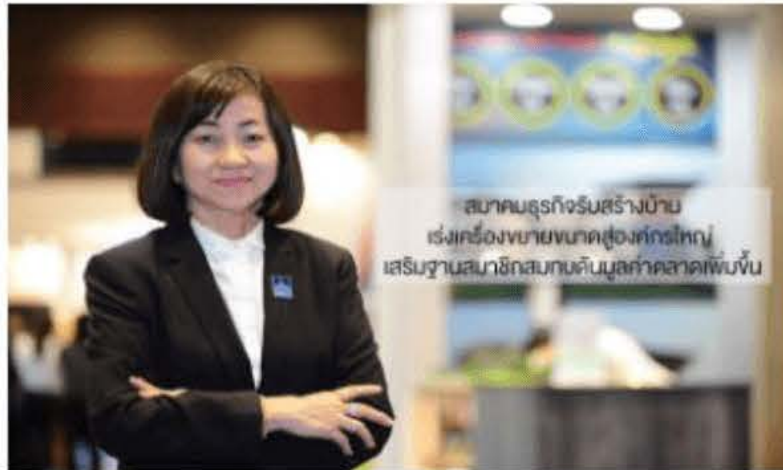
สมาคมธุรกิจรับสร้างบ้าน เร่งเครื่องขยายขนาดสู่องค์กรใหญ่ เสริมฐานสมาชิกสมทบดินมูลค่าตลาดเพิ่มขึ้น